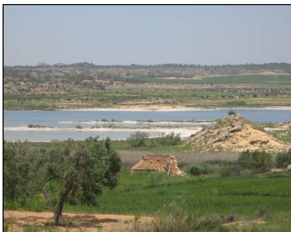
Eflorescencias en la Salada