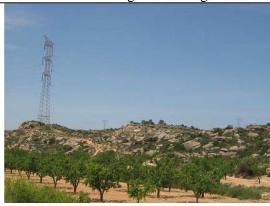
Tren de paleocanales entre Caspe y Chiprana