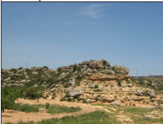
Paleocanales situados entre Caspe y Chiprana

Es un importante ZIG , fundamentalmente por sus características geomorfológicas